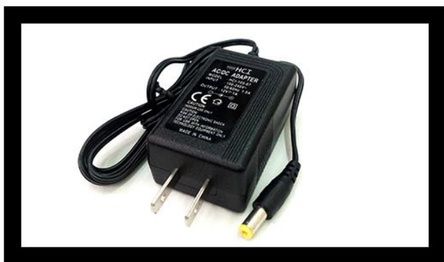
安規電源供應器，提供穩定安全的供電品質