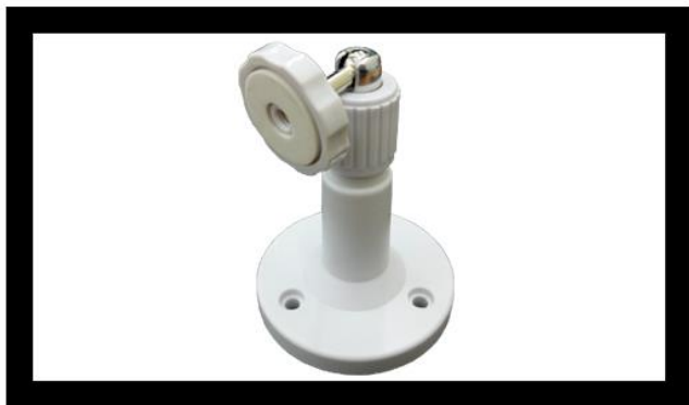
簡易固定架、施工快速便利